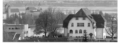
Quartierverein Lenggis-Kempraten 8645 Jona

Engagement für ein lebendiges und lebenswertes Quartier!