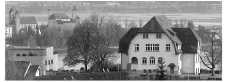
Quartierverein Lenggis-Kempraten 8645 Jona