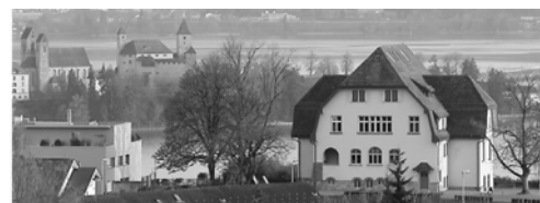
Quartierverein Lenggis-Kempraten 8645 Jona